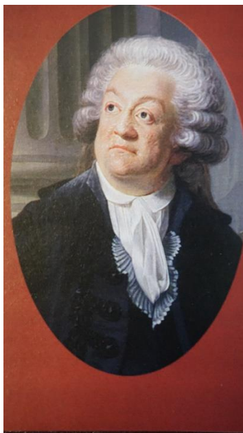
Führender Politiker in der Frühphase der Revolution: Comte de Mirabeau (1749 - 1791)

In den folgenden Wochen ließ sich Campe mitreißen von den revolutionären Ereignissen in der französischen Hauptstadt. Als Kleinstädter - Braunschweig hatte damals ca. 27000 Einwohner - bestaunte er die Architektur der Metropole, den Louvre oder Notre-Dame, aber auch die bis zu siebenstöckigen Wohnhäuser des Volkes. Er besuchte die revolutionären Plätze, das Palais Royal oder die Bastille. Er beobachtete die Erregung und Erhebung der städtischen Massen, nahm selbst teil an politischen Kundgebungen und Sitzungen. Fasziniert war er Augenzeuge, als in der Nacht vom 4. auf den 5. August die Feudalrechte und Adelsprivilegien abgeschafft wurden. Seine Bekanntschaft mit dem Grafen Mirabeau, einem der führenden Köpfe der Nationalversammlung und Verfechter einer konstitutionellen Monarchie, verhalf ihm zur Teilnahme an den turbulenten Sitzungen am 12. und 13. August in Versailles, als die Verabschiedung der Menschenrechte diskutiert und vor den König gebracht wurde.